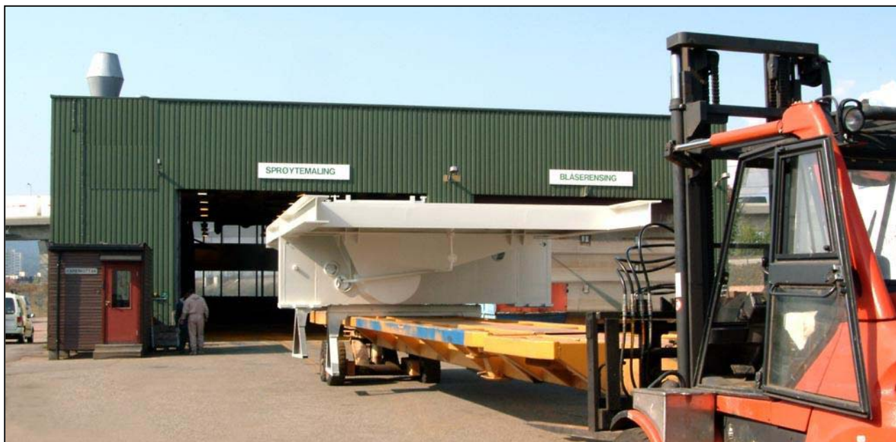
Transport av overflatebehandlet generatorskid