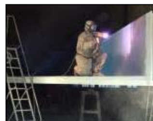
Termisk behandling, lysbue- sprøyting av jernbanebruer