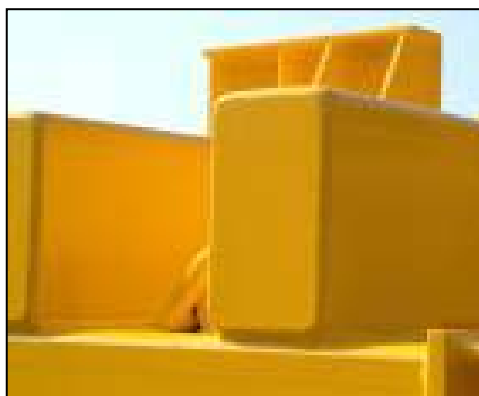
Kattramme til traverskran