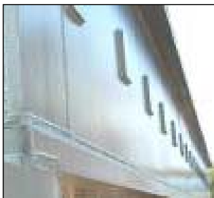
Duplexsystembehandling av jernbane- bruer