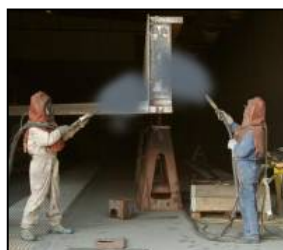
Blåserensing av jernbanebruer